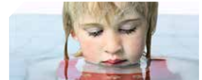
"Arte al Límite"

El 2017 en Espacio Fundación Telefónica, nos visitaron 138.322 personas.