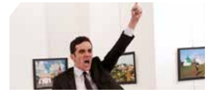
"World Press Photo"