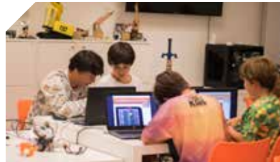
Aula Digital de Espacio Fundación Telefónica.

Cada año queremos ir un paso más allá en nuestro Compromiso con la Sociedad , esto también lo hacemos desde un rol activo dentro de la Revolución Digital en la que estamos inmersos. Para ello, contamos con el Espacio Fundación Telefónica Chile, donde de manera gratuita y permanente, los asistentes pueden ser espectadores de proyectos de Cultura Digital , los que expresan nuevas ideas, tendencias y avances a nivel tecnológico, permitiendo observar otras realidades, debatir, evolucionar y aprender.